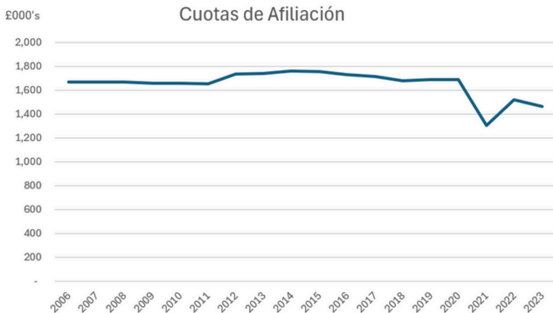
Gráfica 1: Cuotas de Afiliación de 2006 a 2023 [1]

Como se muestra en la Gráfica 1, los ingresos por las cuotas de afiliación (excepto para los años de la pandemia mundial) han representado entre el 30 y el 40 por ciento de los ingresos no restringidos totales de la AMGS. Durante los años de la pandemia mundial, esto se incrementó a cerca del 50 por ciento, debido principalmente a la pérdida de ingresos de los Centros Mundiales.