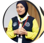
حليمة عبد المطلب ليبيا