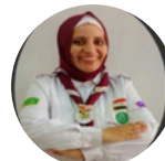
أمنية العربي مصر