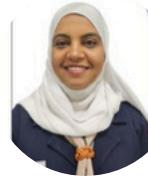
ثرثا الهطالية سلطنة عمان