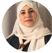
حسينة السنانية سلطنة عمان