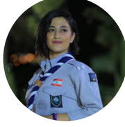
دورا الشيخ علي لبنان